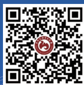
首经贸官方视频号