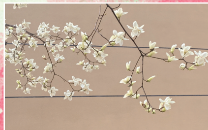
慎思楼窗边的玉兰花 朱梅红 统计与数据科学学院教职工