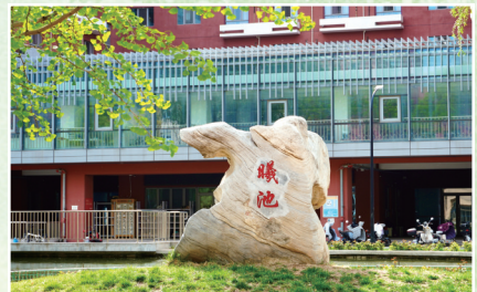
郁见经贸 不负春光(组图) 杨博翔 财政税务学院学生