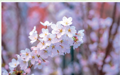
春圃芳痕(组图) 杨素 马克思主义学院学生