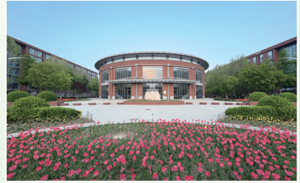
红砖与绿植，蓝天与花海 张兆强 财政税务学院教职工