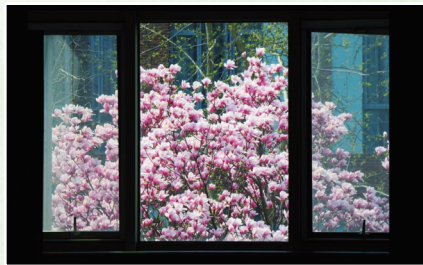
窗嵌玉兰春 万尚瑾 劳动经济学院学生