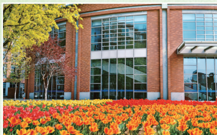
春满校园 郁金香香 张海楠 工商管理学院学生