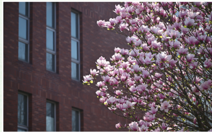
经贸春序 郁染清兰 李尧卓 文化与传播学院学生