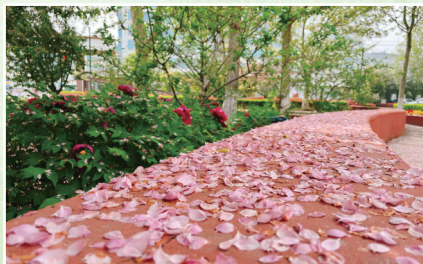
春落胭脂 雷露 人事处教职工