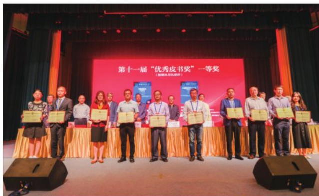
9月25日,第二十一次全国皮书年会(2020)召开,我校《京津冀蓝皮书(2019):打造创新驱动经济增长新引擎》获第十一届“优秀皮书奖”一等奖。(特大城市经济社会发展研究院)